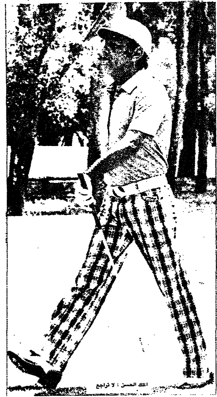
الملك الحسن لا تراجع

ما قرره لجنة الحكماء في اجتماعها الأخير في فريتاون بشأن قضية الصحراء الغربية ليس أمراً جديداً في واقع الأمر على الأقل من حيث الشكل الظاهري للقرار ، فقد كان تنظيم استفتاء عام لسكان الصحراء الغربية بأثراف الأمم المتحدة مطروحا منذ عام 1976 ، ولكن الجديد في الاجتماع الأخير هو التطورات التي حدثت في الموقف الجزائري من قضية النزاع حول الصحراء الغربية ، وعلى الرغم من أن هذه التطورات الجديدة لا زالت بعيدة لحد ما عن استئجاب جزائري تام من الاعتراف بجهينة البوليساريو إلا أنها تؤكد التعهد من المؤشرات التي ظهرت في الفترة الأخيرة على الموقف الجزائري .